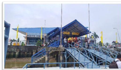
Gambar 2.1 Dermaga Wisata Sanggam (Ex. Pasar Gayam)