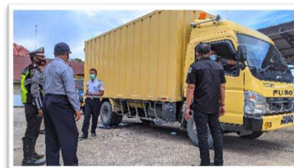
Gambar 2.2 Kegiatan penertiban/penegakan hukum perizinan operasi angkutan, dimensi dan muatan lebih kendaraan bermotor di jalan

Strategi dan arah kebijakan dalam mencapai tujuan dan sasaran dalam rangka pencapaian visi dan misi yang diuraikan dalam tujuan dan sasaran, penyusunan strategi dan arah kebijakan pembangunan daerah menjadi bagian penting yang tidak terpisahkan. Strategi adalah langkah-langkah berisikan program-program indikatif untuk mewujudkan visi Dan misi.