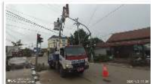
Gambar 1.1 Perbaikan dan Perawatan Traffic Light