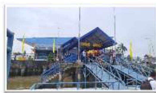
Gambar 2.1 Dermaga Wisata Sanggam (Ex. Pasar Gayam)