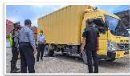
Gambar 2.2 Kegiatan penertiban/penegakan hukum perizinan operasi angkutan, dimensi dan muatan lebih kendaraan bermotor di jalan

Strategi dan arah kebijakan dalam mencapai tujuan dan sasaran dalam rangka pencapaian visi dan misi yang diuraikan dalam tujuan dan sasaran, penyusunan strategi dan arah kebijakan pembangunan daerah menjadi bagian penting yang tidak terpisahkan. Strategi adalah langkah-langkah berisikan program-program indikatif untuk mewujudkan visi Dan misi.